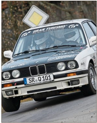
Erstmals wird es heuer einen Gäubodensprint bei der „Auto-Freizeit-2014“ geben.