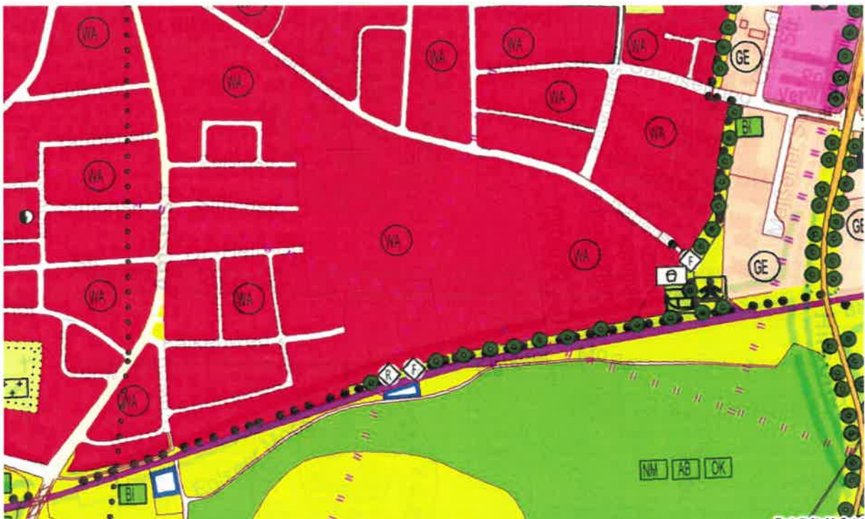
Unmaßstäblicher Auszug des Flächennutzungs- und Landschaftsplans (Planungsstand 10.01.2020)