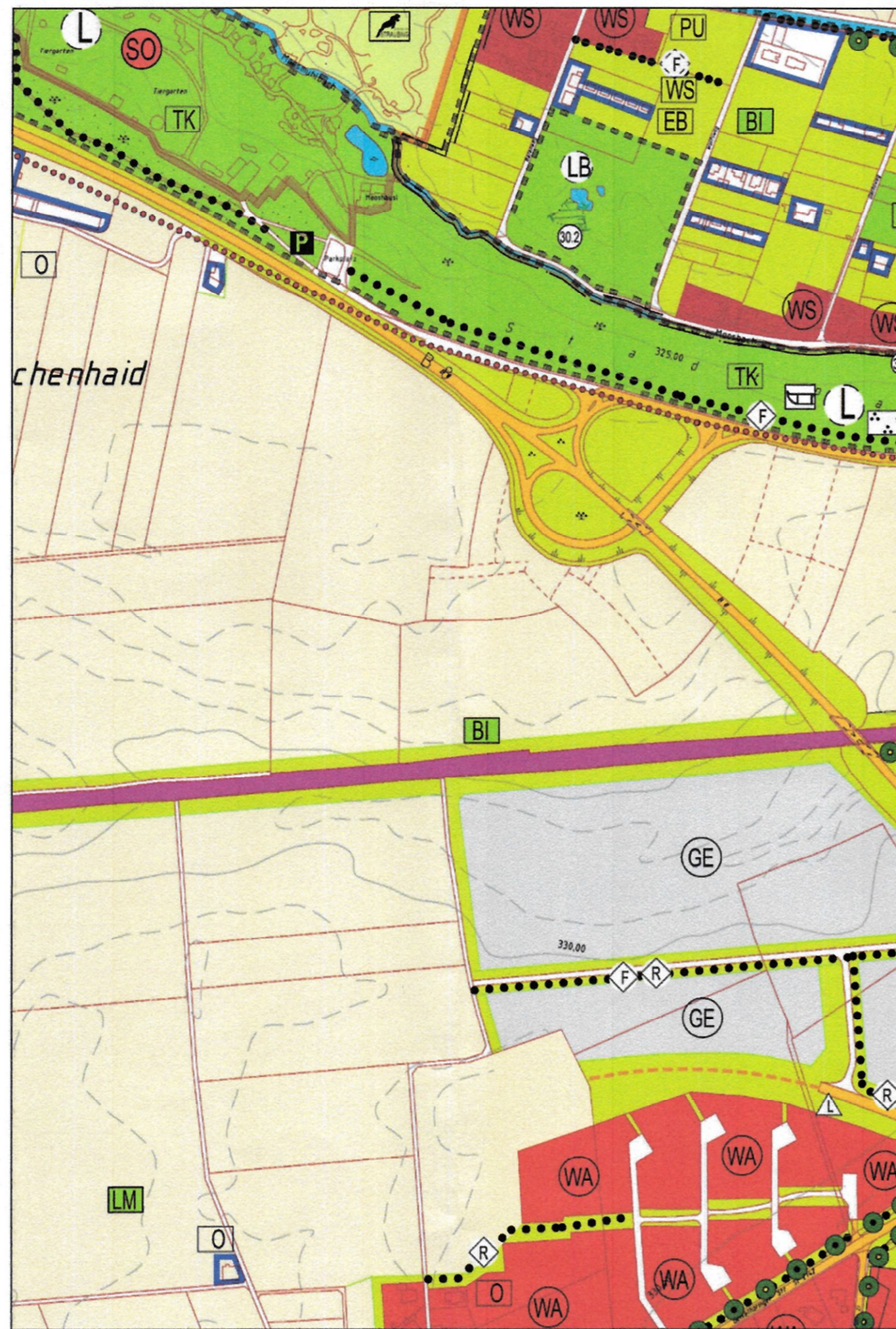
Auszug aus dem Flächennutzungs- und Landschaftsplan der Stadt Straubing rechtswirksam seit 13.07.2006 (Stand 16.04.2021)