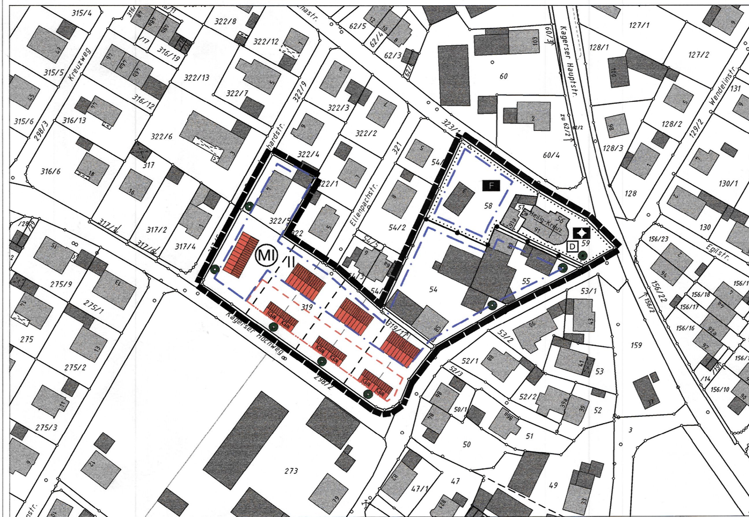
Bebauungsplan M 1:1000